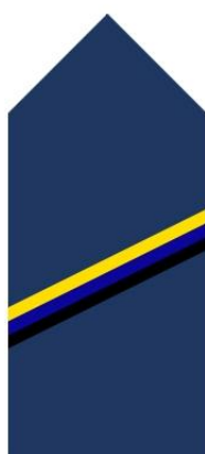
UNITARNY + ŁĄCZNOŚĆ