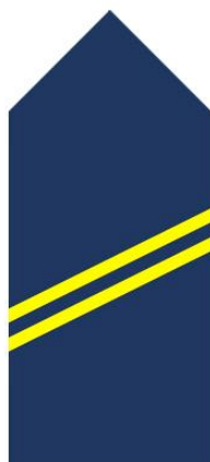
KURS I STOPNIA FKO