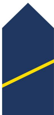
KURS UNITARNY FKO