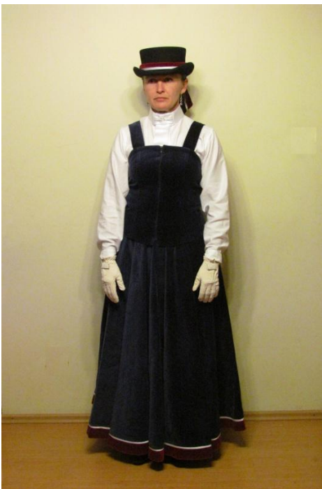
STRÓJ REPREZENTACYJNY 1