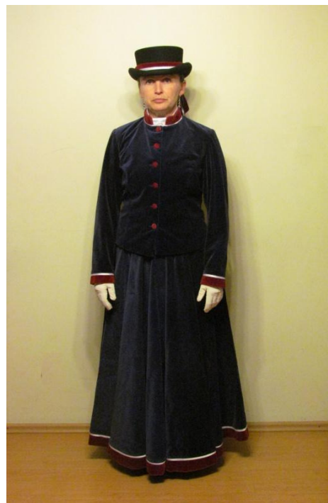
STRÓJ REPREZENTACYJNY 2